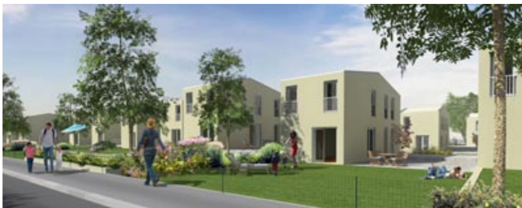
Abb. 1: Animation der Anlage 22., Pelargonienweg

Kleingartenhäuser dürfen eine Grundfläche von 50 m 2 und eine Höhe von 5,50 nicht überschrei-